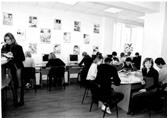
Інтегрований читальний зал

Працівники бібліотеки – це молоді люди, захоплені своєю роботою, вони володіють навичками критичного мислення, добре розуміють сутність та особливості бібліотечної роботи з користувачем, наділені творчими здібностями – пишуть вірші, складають сценарії свят, малюють тощо. Анкетування, які неодноразово проводилися у бібліотеці, засвідчують, що саме таким і хочуть бачити бібліотекаря наші студенти – сучасною людиною у всіх її проявах: інтелектуально розвиненою, всебічно обізнаною, модно одягненою, красивою, привітною і завжди усміхненою.