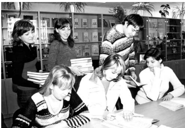
Читальний зал періодичних видань

Сучасний бібліотечно-інформаційний сервіс ставить на перше місце користувача як центральну постать, навколо якої концентрується вся увага. Необхідність виховання та розвитку особистості в кожному представникові молодого покоління накладає на бібліотеку додаткову відповідальність за формування навичок інтелектуальної праці, творчого розвитку внутрішнього світу студента, виховання почуття гордості за навчальний заклад, де він здобуває вищу освіту. Новим словом в оформленні автоматизованого читального залу стала ексклюзивна експозиція персональних колажів, присвячених науковцям – працівникам університету та відомим діячам науки України і зарубіжжя, які відвідали наш університет. Колажі презентують особистість науковця через інформацію про його доробок, відгуки про відвідання бібліотеки, фрагменти зустрічей зі студентами. Багато з колажів мають автографи. Для студентів вони є своєрідною фіксацією історичної миті в їхньому житті, навчанні, спілкуванні з цікавими та знаменитими людьми.